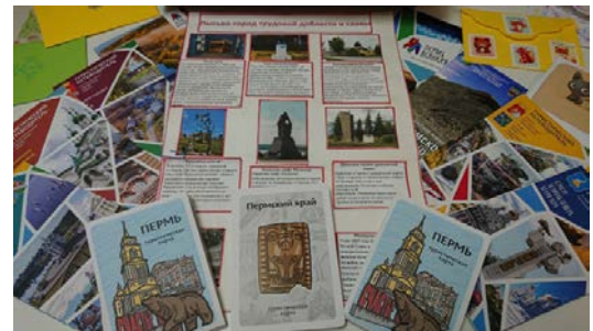
Лысьва, Пермский край