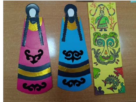
Комсомольск-на-Амуре, Хабаровский край