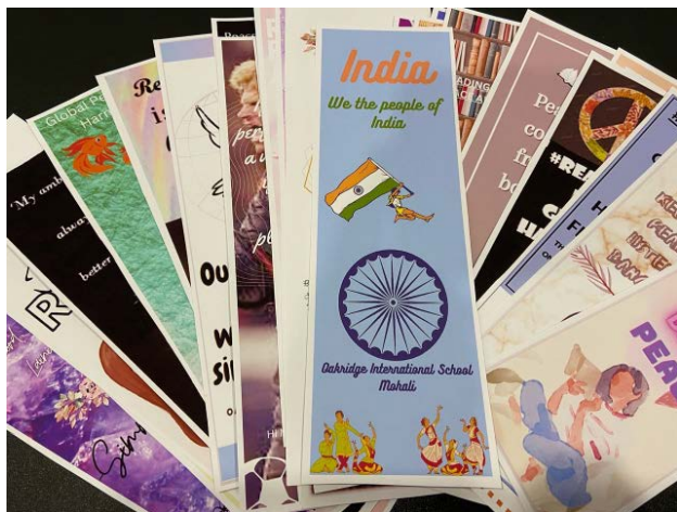
Индия. Цифровые закладки