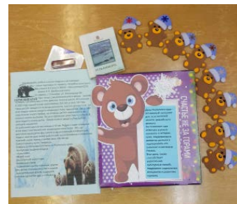
Усть-Кишерть, Пермский край