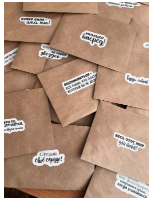
Волжский, Волгоградская область