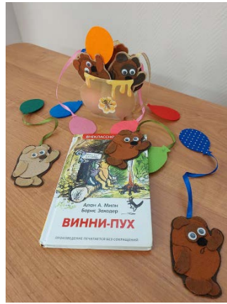
Зарёвск, Московская область