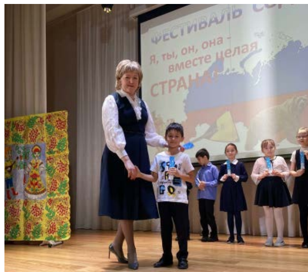
Мегион, ХМАО. Торжественное вручение закладок от партнёров