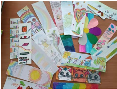
Северск, Томская область