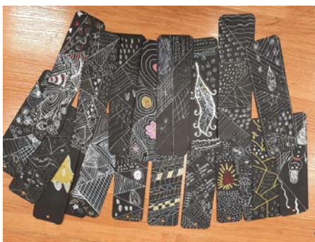
Петрозаводск, Республика Карелия