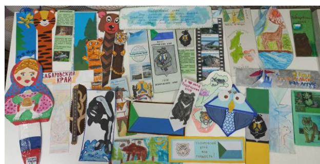
Мир природы в закладках