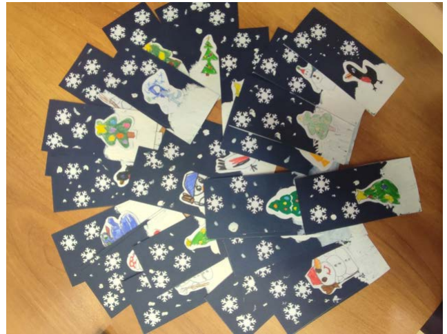
Новоуральск, Свердловская область