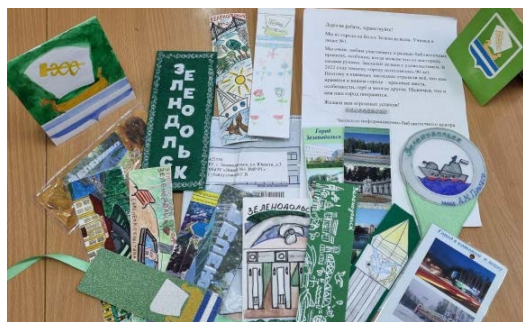
Зеленодольск, Республика Татарстан