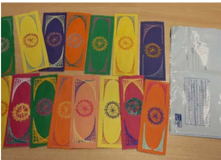
Бикин, Хабаровский край