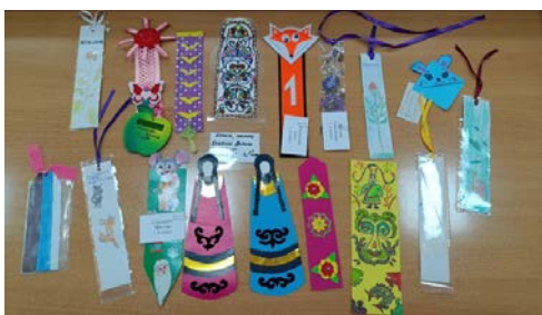
Комсомольск-на-Амуре, Хабаровский край