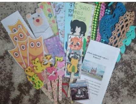
Канск, Красноярский край