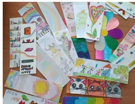
Северск, Томская область