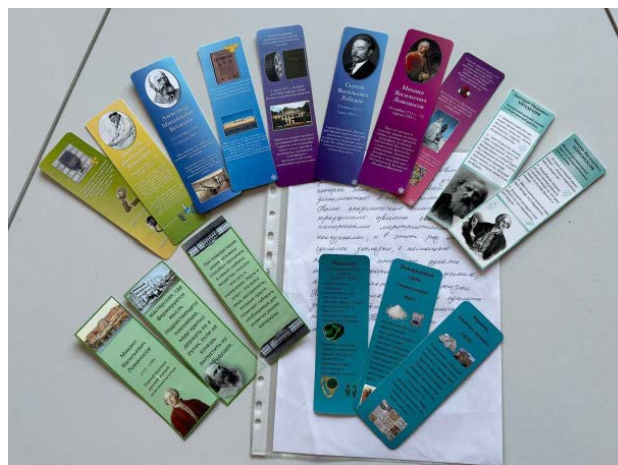
Серия закладок «Сказки Пушкина»