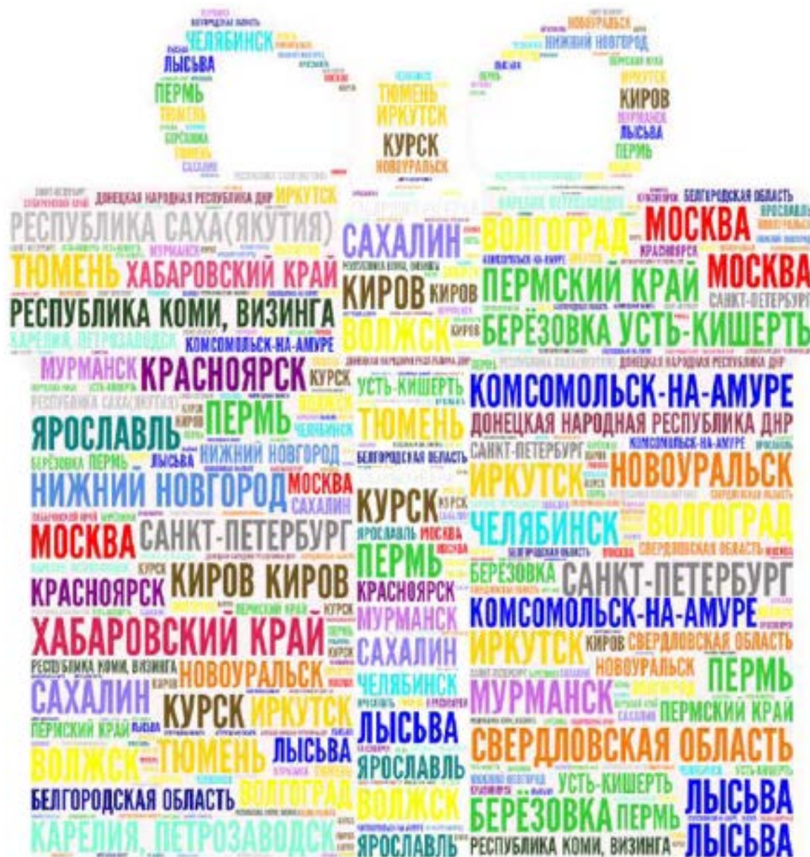
Регионы – участники проекта