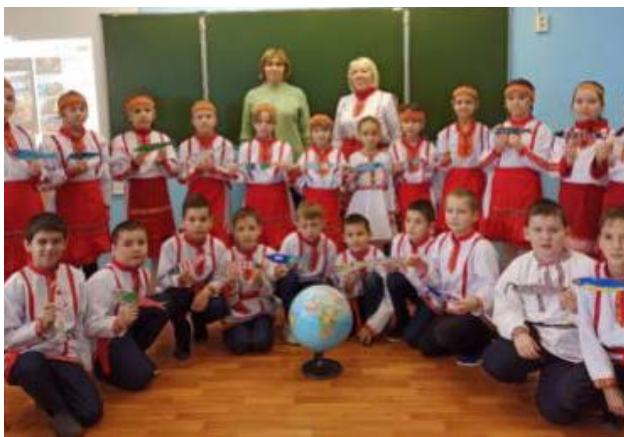
Участники проекта, Чувашия

Другими словами, в этом проекте мы собираем некую «капсулу», «коробку» культуры своего региона, города, села и т.п. И отправляем своим партнёрам. Таким образом происходит очень интересный обмен и открытия участниками (не только маленькими) новых уголков России.