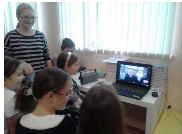
Онлайн-встреча: ЛНР, Зоринск – Лысьва