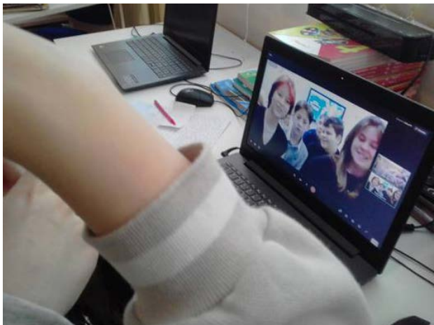
Онлайн-встреча: Лысьва – Санкт-Петербург