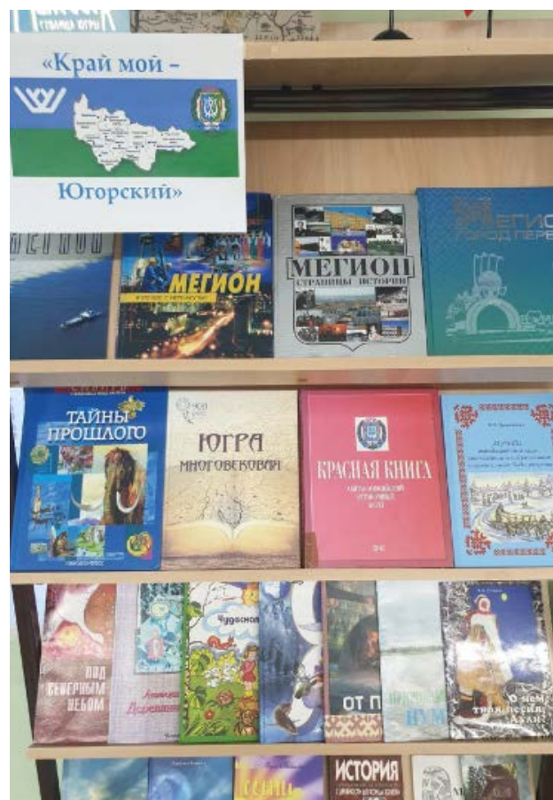
Книжная выставка участников проекта, ХМАО