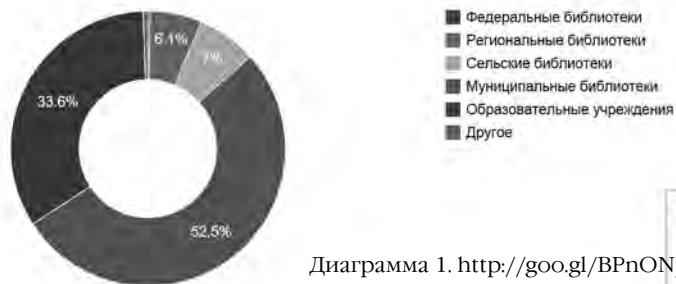
Диаграмма 1. http://goo.gl/BPnONj

Предполагаемое на основании заявочной анкеты количество слушателей вебинаров – 1863 человека от 345 организаций. На диаграмме 1 показаны организации-участницы в процентном соотношении. Представлены библиотеки всех видов – от федеральных до сельских, из них 69 детских и детско-юношеских, образовательные учреждения: школы, гимназии, колледжи, суворовские училища, центры дополнительного образования и др.