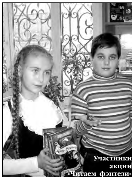
Участники акции «Читаем фэнтези»

Подростки и чтение – это словосочетание сегодня навевает тревожные размышления, так как книга в жизни современных школьников занимает далеко не первое место. Сами подростки признают, что читают редко и мало, только по школьной программе, и чтение не входит в число любимых занятий.