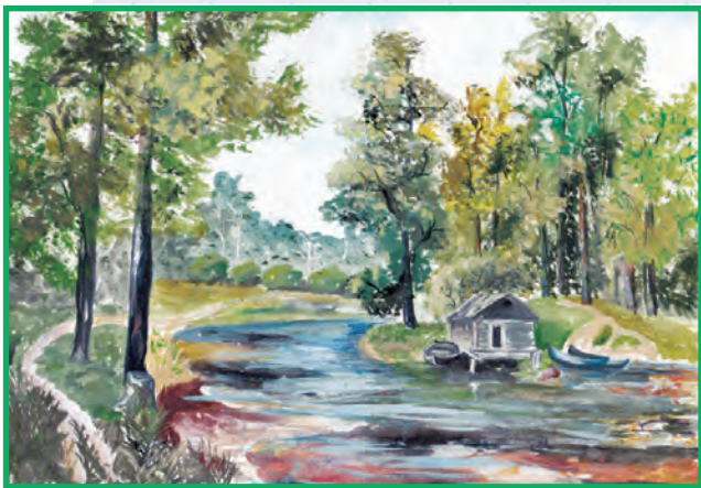
Пейзаж с озером