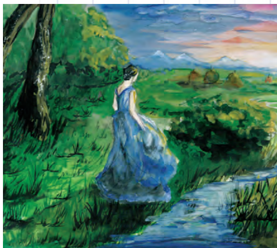
Вставая с первыми лучами