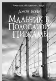
Джон Бойн Мальчик в полосатой пижаме. – М.: Фантом Пресс, 2013. – 288 с.

До прочтения этой книги я не задумывалась о цене тех поступков, которые совершаю. Да, говорят, что за все сделанное мы будем расплачиваться после смерти, и знаете, пожалуй, этот вариант – самый безобидный из всех, которые могут случиться. Отвечать за все самому гораздо безобиднее, чем когда за твои поступки платят самые близкие тебе люди, причем платят на твоих глазах. Именно такая ситуация произошла в этой книге. Наказание отцу за то, что он делал, пришлось через его маленького и ничего не знающего сына.