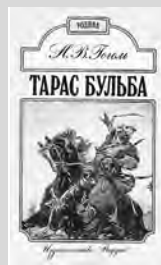
Н.В. Гоголь Тарас Бульба

Порой к произведениям, которые изучают в школе, привязываются стереотипы. Столько раз о них говорили и писали критики и школьники, что кажется, ни добавить, ни убавить. Но недавно я убедился, что это не так, и хочу поделиться с вами этим ощущением – когда незыблемое становится шатким, когда то, что говорит глубоко уважаемый мною учитель, не совпадает с тем, что говорит любимая мама. Когда приходится самостоятельно делать вывод о том, что для меня значит прочитанная книга. И это, скажу я вам, непросто!