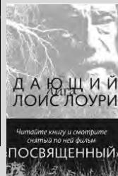
Лоис Лоури Дающий. – Розовый жираф, 2014. – 200 с.