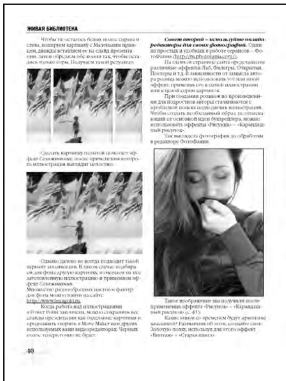
2014. – № 9. – С. 40