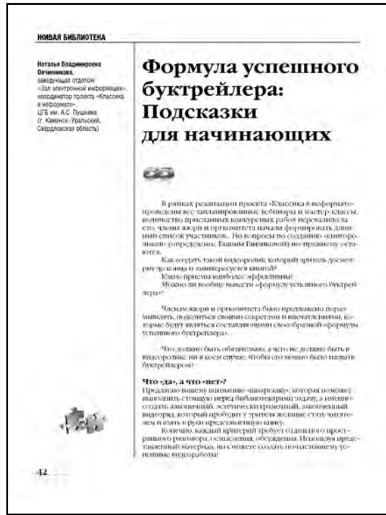
2014. – № 9. – С. 42