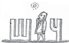
4.2. Главное — это заглавие

Заглавие чаще всего становится отправной точкой для разыскания произведения или издания. Читатели часто смешивают заглавие произведения и заглавие издания, в котором оно опубликовано. В одних