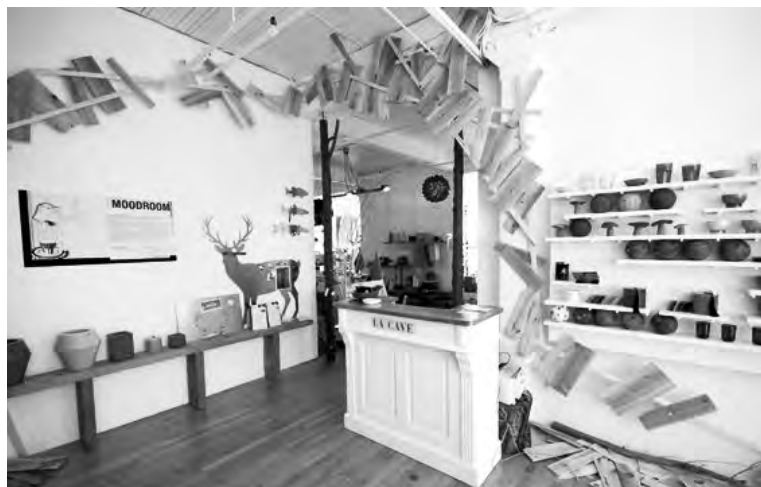
Воркшоп-студия в Монреале