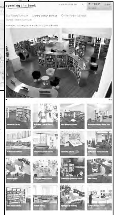
Страница галереи изображений портала Opening the book

работе, на сайте компании можно увидеть множество интересных деталей, например разнообразные ткани для обивки мягкой мебели, необычные напольные покрытия и примеры их сочетания, дизайн навигационных элементов и пр. Отдельный раздел сайта посвящен оснащению школьных библиотек. Резюмируя, отметим приятное оформление и грамотное наполнение сайта.