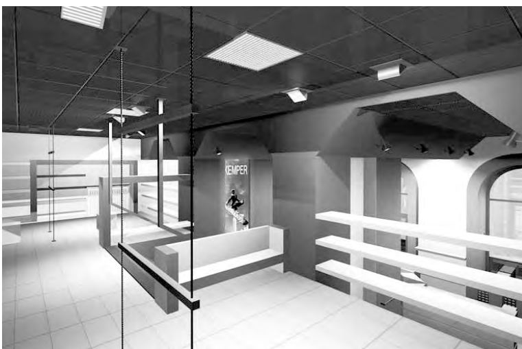
Торговый зал магазина