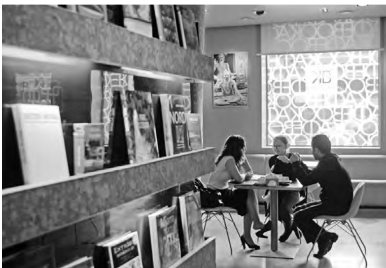
Кафе в Москве